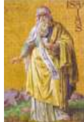
09-S. Isaías Profeta