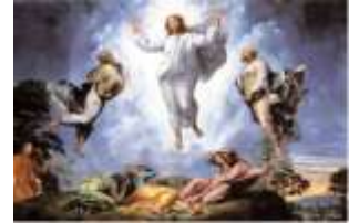
14- Ascensión del Señor