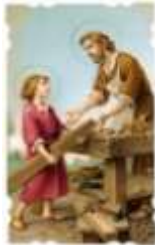
01-S. José Obrero