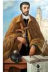
10. San Juan de Ávila