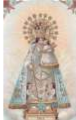
09- N. Sra. de los Desamparados