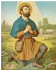
15-S. Isidro Labrador