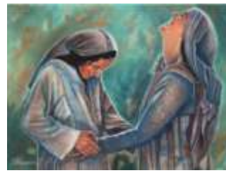
31-Visitación de la Virgen María