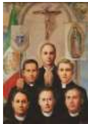
21-Santos Mártires Mexicanos KofC