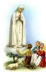
13- N. Sra. de Fátima