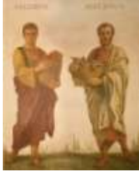
03- Ss. Felipe y Santiago