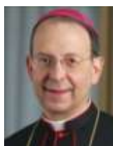
DEL CAPELLÁN SUPREMO ARZOBISPO WILLIAM E. LORI