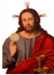
28- Jesucristo Sumo y Eterno Sacerdote